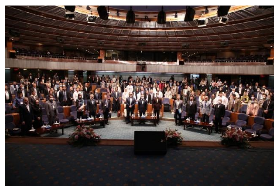
مراسم رسمی رویداد