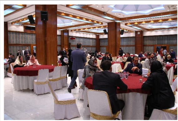
جلسات رو در رو