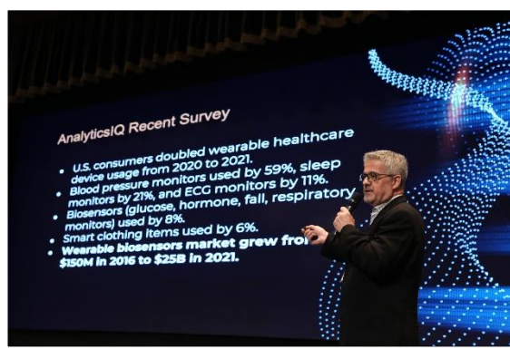
Health Tech Talk