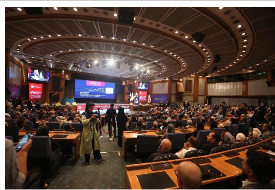
مراسم رسمی رویداد