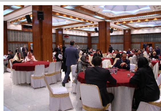
جلسات رو در رو